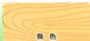
色合いは印刷のため、実際とは若干異なります。