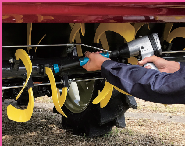
▲ 耕運機の爪交換に ▼